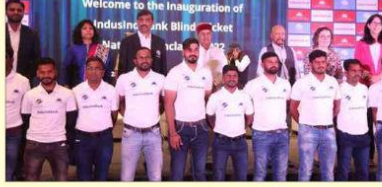
ದೈಕಮಿಷನರ್ ಸೌತ್ ಏಷ್ಯಾ ಟ್ರಸ್ಟ್

ಲಾಘಿಮ ಸಂಸ್ಥೆಯ ಸಿಬ್ಬಂದಿ, ಕಾರ್ಪೊರೇಟ್ ಸಂಸ್ಥೆಗಳ ಮುಖ್ಯಸ್ಥರು, ಸರಕಾರದ ಗಣ್ಯರು, ಹಾಗೂ ದೃಷ್ಟಿ ವಿಶೇಷಚೇತನ ಕ್ರಿಕೆಟ್ ತಂಡದ ಸದಸ್ಯರು ಸಮ್ಮೇಳನದಲ್ಲಿ ಪಾಲ್ಗೊಂಡಿದ್ದರು. ಕರ್ನಾಟಕ ರಾಜ್ಯದ ಘನತಮತ್ರ ರಾಜ್ಯಪಾಲರಾದ ಶ್ರೀ ಶಾನ್ತಲಾಲ್ ಗೆಹ್ಲೋಟ್ ಅವರು ಇಂಡಸ್ ಇಂಡ್ ಬ್ಯಾಂಕ್ ದೃಷ್ಟಿವಿಶೇಷಚೇತನ ಕ್ರಿಕೆಟ್ ರಾಷ್ಟ್ರೀಯ ಸಮ್ಮೇಳನ- 2022ರ ಉದ್ಘಾಟನಾ ಸಮಾರಂಭದ ಮುಖ್ಯ ಅತಿಥಿಗಳಾಗಿ ಪಾಲ್ಗೊಂಡಿದ್ದರು. ಇನ್ನೊಬ್ಬ ಅಂತ್ಯ ಚೇಷ್ಟೆ