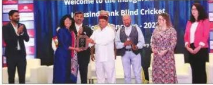
ಇಂಡಸ್‌ಲ್ಯಾಂಡ್ ಬ್ಯಾಂಕ್ ಬ್ಲಿಂಡ್ ಕ್ರಿಕೆಟ್ ರಾಷ್ಟ್ರೀಯ ಸಮ್ಮೇಳನ.