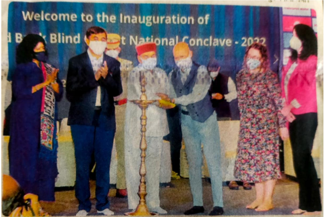
बेंगलूरु में सोमवार को नेत्रहीन क्रिकेट पर आयोजित राष्ट्रीय सम्मेलन का उद्घाटन करते राज्यपाल थावरचंद गहलोत, साथ में पूर्व क्रिकेटर सैयद किरमानी व अन्य।