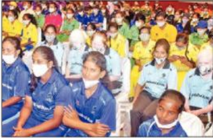
ಸಮಾರಂಭದಲ್ಲಿ ಭಾಗವಹಿಸಿದ್ದ ಕ್ರೀಡಾಳುಗಳು.