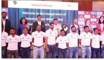
“ಇಂಡಸ್ ಇಂಡ್ ಬ್ಯಾಂಕ್ ದೃಷ್ಟಿ ವಿಶೇಷಜೇತನರ ಕ್ರಿಕೆಟ್ ರಾಷ್ಟ್ರೀಯ ಸಮ್ಮೇಳನ - 2022” ಘಾರತೀಯ ದೃಷ್ಟಿ ವಿಶೇಷಜೇತನರ ಕ್ರಿಕೆಟ್ ಸಂಸ್ಥೆಯು (ಅಂಚೆ) ಸಮರ್ಥನಮಾ ವಿಶೇಷ ಜೇತನರ ಸಂಸ್ಥೆಯ ಸಹಯೋಗದೊಂದಿಗೆ ಆಯೋಜಿಸಿದ್ದ 3ನೇ ಇಂಡಸ್ ಇಂಡ್ ಬ್ಯಾಂಕ್ ದೃಷ್ಟಿ ವಿಶೇಷಜೇತನರ ಕ್ರಿಕೆಟ್ ರಾಷ್ಟ್ರೀಯ