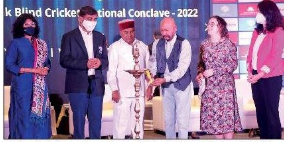
ಕಾರ್ಯಕ್ರಮವನ್ನು ರಾಜ್ಯಪಾಲ ಥಾವರ್ ಚಂದ್ ಗೆಹ್ಲೋಟ್ ಉದ್ಘಾಟಿಸಿದರು.

'ಇಚ್ಛಾ ಶಕ್ತಿ ಹೊಂದಿದ್ದರೆ ಎಲ್ಲ ಸವಾಲುಗಳನ್ನು ಮೀರಿ