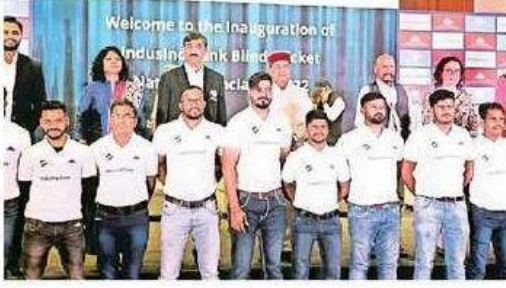
గవర్నర్ థావర్ చంద్ గవోటితో దివ్యాంగ క్రీకెటర్లు